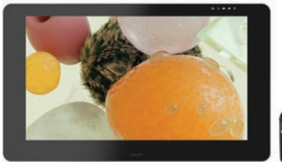
Künstler: David McLeod

Wacom Cintiq Pro 32 und 24 sind hochentwickelte Kreativ-Stift-Displays. In Verbindung mit dem Wacom Pro Pen 2 machen sie jeden kreativen Durchbruch noch besser.